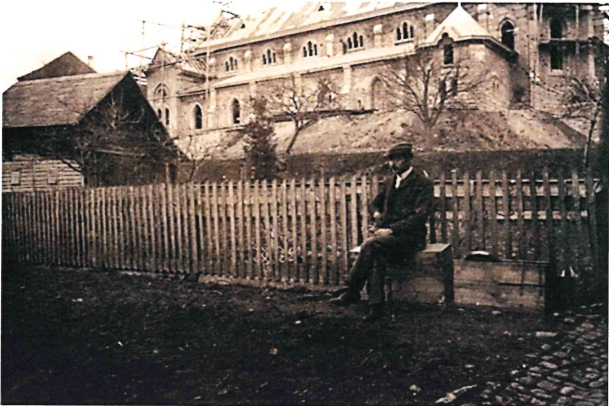
Bau der Kirche 1905

Die genauen Informationen zu diesen Angeboten erfahren sie jeweils im Pfarrblatt.